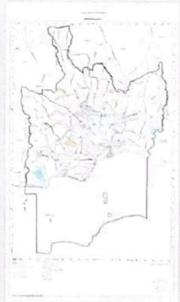
แผนผังแสดงแหล่งทรัพยากรธรรมชาติและสิ่งแวดล้อม