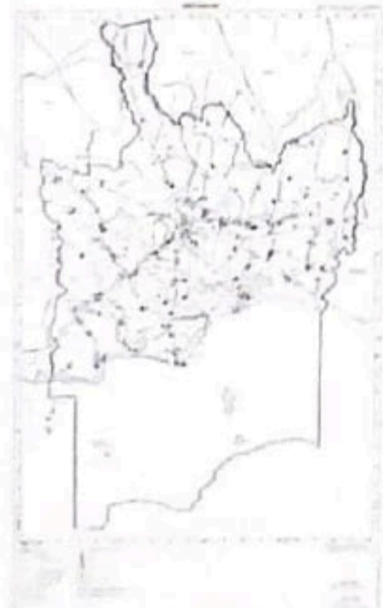
แผนผังแสดงโครงการกิจการสาธารณูปโภค สาธารณูปการ และบริการสาธารณะ แผนที่ ๒