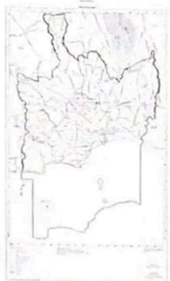
แผนที่แสดงเขตท้องที่ที่จะวางและจัดทำผังเมืองรวม

นอกจากนี้ กรมโยธาธิการและผังเมือง และสำนักโยธาธิการและผังเมืองจังหวัดระยอง จัดให้มีการประชุมเพื่อรับฟังข้อคิดเห็นของประชาชน เกี่ยวกับการวางและจัดทำผังเมืองรวมชุมชนแกลง จังหวัดระยอง ในวันอังคารที่ ๒๑ ธันวาคม พ.ศ. ๒๕๖๔ เวลา ๐๙.๐๐ น. ณ หอประชุมอำเภอแกลง จังหวัดระยอง