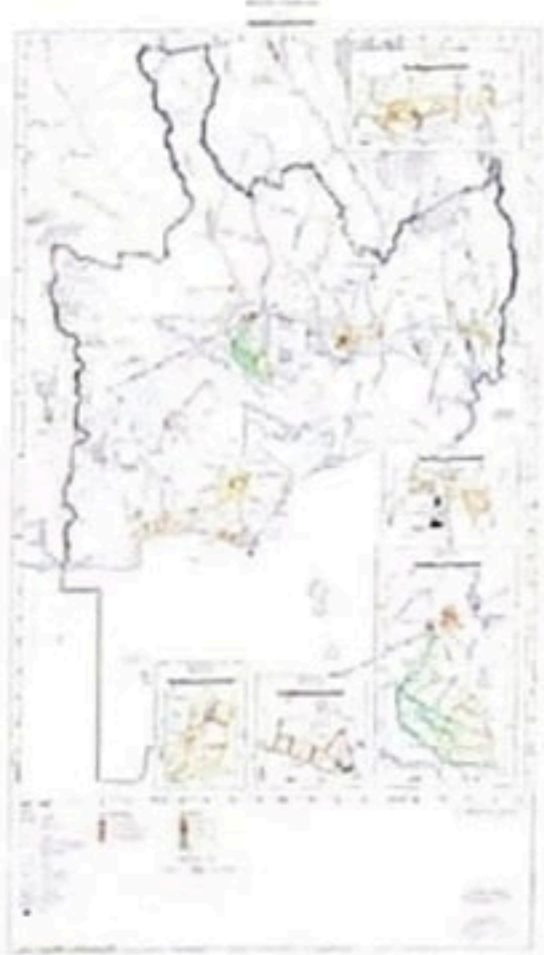
แผนผังแสดงโครงการการคมนาคมและการขนส่ง