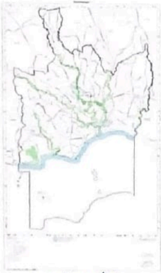
แผนผังแสดงที่โล่ง