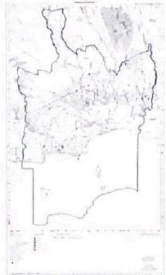
แผนผังแสดงโครงการกิจการสาธารณูปโภค สาธารณูปการ และบริการสาธารณะ แผนที่ ๑