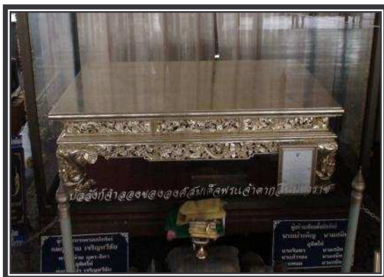
บัลลังก์จำลองขององค์สมเด็จพระเจ้าตากสินมหาราช

สำหรับบัลลังก์ที่ประทับนั้น เมื่อ พ.ศ.๒๔๖๐ สมเด็จพระสังฆราชเจ้า กรมหลวงวชิรญาณวงศ์ สมัยเมื่อมีสมณศักดิ์ที่พระญาณวราภรณ์ ตำแหน่งเจ้าคณะมณฑลจันทบุรี ได้มาตรวจการคณะสงฆ์ และเมื่อมาถึงเมืองแกลงได้มาพักแรมที่วัดราชบัลลังก์ เพราะเป็นวัดที่เจ้าคณะแขวงประจำอยู่ ทางวัดได้นำบัลลังก์มาจัดเป็นอาสนะถวายการต้อนรับ