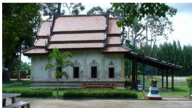
พระอุโบสถเก่าแก่อายุกว่า ๒๐๐ ปี (ด้านข้าง)