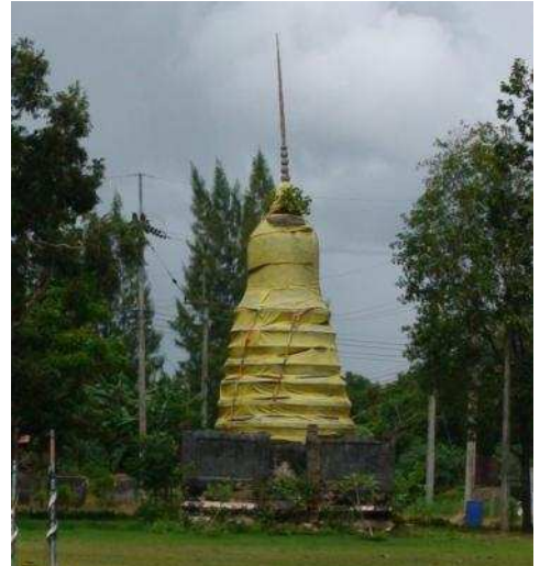
พระพุทธรูปโครงหวาย (องค์บน)