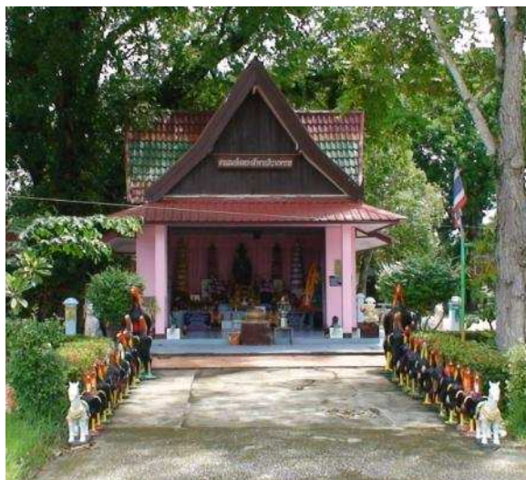
ศาลสมเด็จพระเจ้าตากสิน