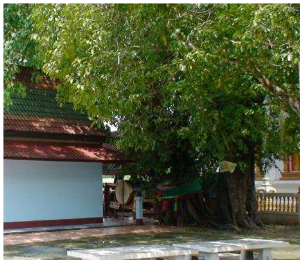
ต้นข่อยที่ผูกข้างทรง