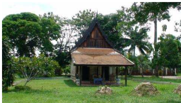
พระอุโบสถเก่าแก่อายุกว่า ๒๐๐ ปี (ด้านหน้า)

สิ่งก่อสร้างโบราณสถานที่ยังคงเหลืออยู่ คือ พระอุโบสถเก่าและเจดีย์เก่าแก่พระอุโบสถเก่าสร้างขึ้นในสมัยขึ้นในสมัยกรุงธนบุรี เป็นผนังก่ออิฐถือปูน ชุ่มประคูดหน้าต่างปูนปั้นประดับด้วยกระเบื้องด้วยลายคราม กล่าวได้ว่าเป็นผลงานสถาปัตยกรรมวัดกึ่งไทยกึ่งจีนที่วิจิตรงดงามมากแห่งหนึ่งในยุคนั้น