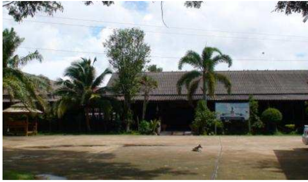
วัดราชบัลลังก์ประดิษฐาราม