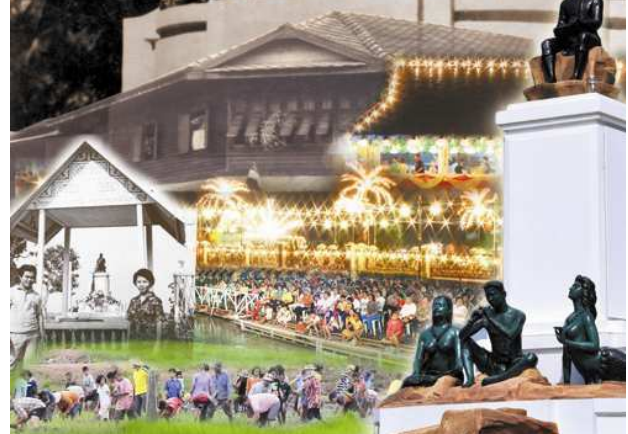
ศาสตราจารย์ศิลป์ พีระศรี ปั้นที่ปี พ.ศ. ๒๔๙๘

เมื่อข้าพเจ้าเห็นตัวกับโครงร่างของท่าน อาจารย์ศิลป์ พีระศรีได้ปั้นอนุสาวรีย์จำลองขึ้นมาสูงประมาณ ๔๐ เซนติเมตร ตัวตนเป็นปูนปั้น ส่วนตัวแท่นเข้าใจว่าเป็นไม้