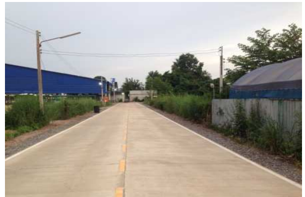
แล้วเสร็จ

๓. โครงการจัดทำรางรับน้ำฝนชายคาอาคารโรงเรียนอยู่เมืองแกลงวิทยา (กองการศึกษา)