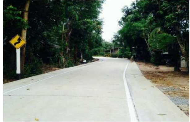
แล้วเสร็จ

๒. โครงการก่อสร้างและปรับปรุงถนนสายแยกจากถนนเทศบาล ๒ ซอย ๗ ไปหลังวัดมนานุกิจ (กองช่าง)